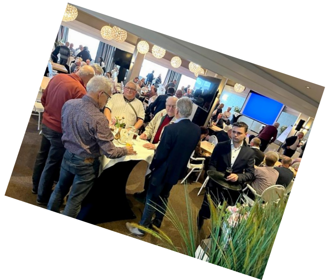
Borrelen na afloop