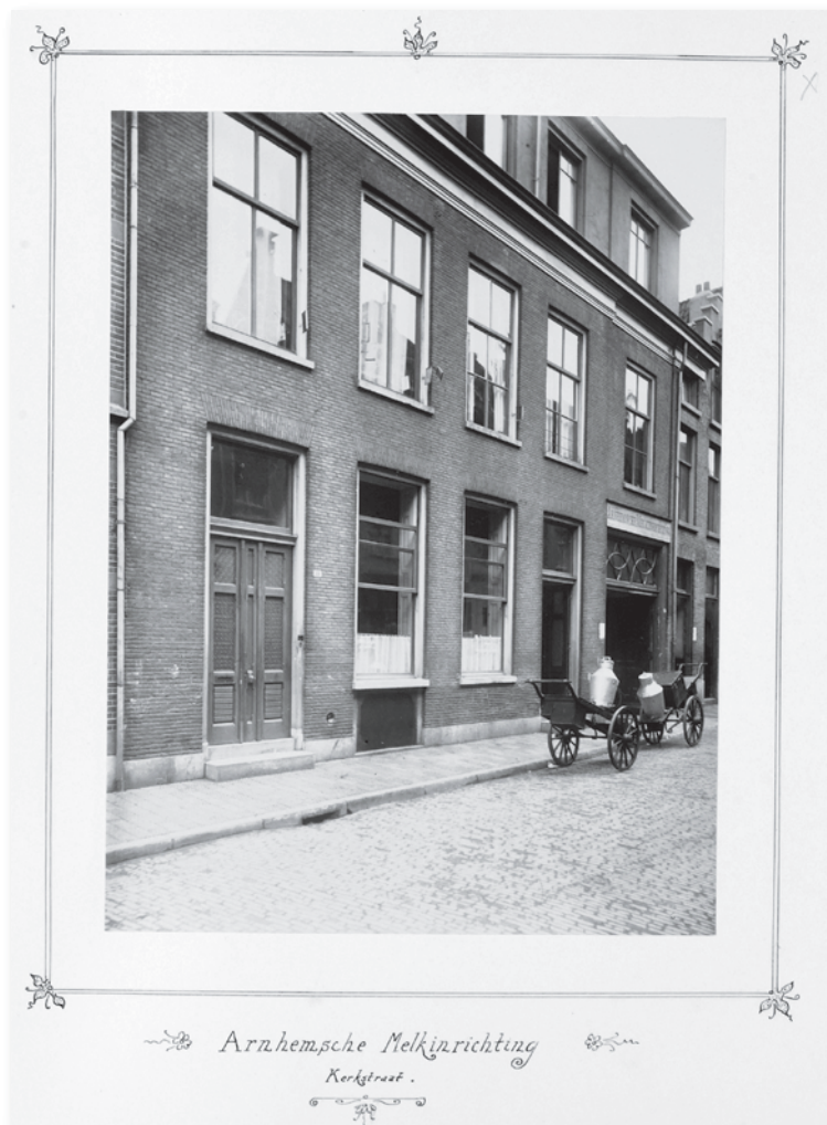
Het gebouw van de eerste Arnhemse Melkinrigting in het gedenkboek van het brandwezen, eind 19e eeuw.

De eerste melk werd geleverd op 16 mei 1879. Daarmee was de wens om een beker 'ongewaschen' melk te kunnen drinken gerealiseerd.