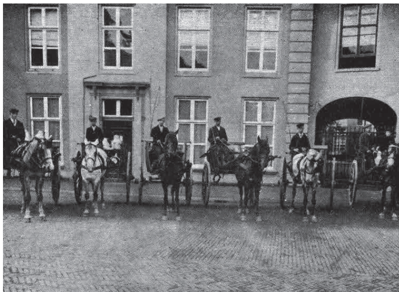
Foto melkleveranciers uit jubileumboekje 1904 bij poortje in de Kerkstraat.