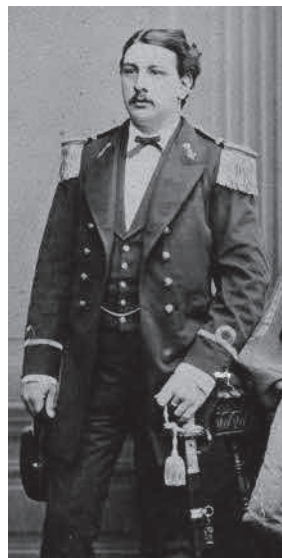
Portret van W.H van Braam in uniform omstreeks 1875.

Willem Hendrik van Braam (1851-1918) komt uit een familie van marine officieren. Een van zijn voorvaderen was Jacob Pieter van Braam (1737-1803) die eind 18 e eeuw het Nederlands gezag vestigde op de Riouw-archipel in Sumatra. Willem Hendrik begon 15 jaar oud als adelborst 3 e klasse bij de marine, kreeg 10 jaar later eervol ontslag als 1 e luitenant ter zee en verliet uiteindelijk de marine als kapitein in 1881.