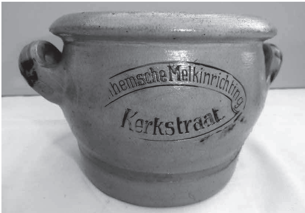
Keulse pot voor de aflevering van boter (in bezit auteur)