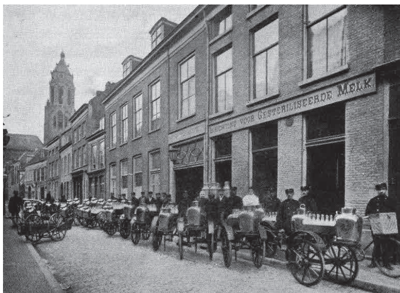
Foto Kerkstraat uit jubileumboekje 1904.